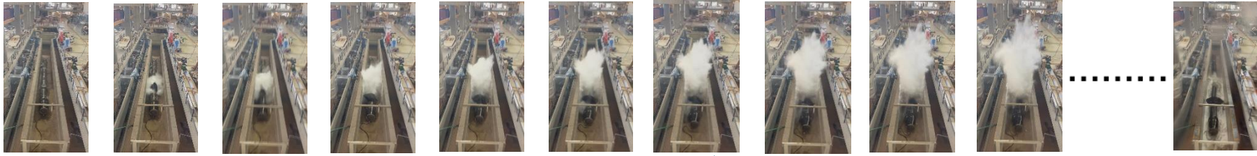
Μακρινή άποψη →