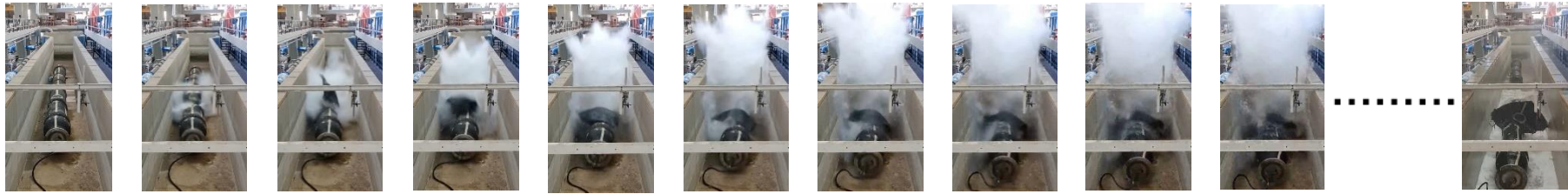
Κοντινή πλάγια όψη →